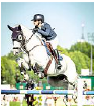
Show a Milano Carla Cimolai in azione: atteso un grande Concorso